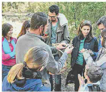
ipantes escucha las explicaciones del guía. AETSA