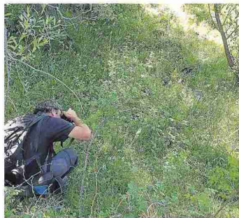
grafiar orquídeas. AETSA

Los días 16, 17 y 18 de junio, Tarazona volverá a celebrar sus Jornadas de la Coronación durante las que se celebrará un mercado renacentista, y tendrán lugar diversos actos de animación infantil, teatral y musical con ambientación centrada en dicha época histórica. Las jornadas se inspiran en la Coronación del Emperador Carlos V, que es el motivo ornamental que decora el friso de la fachada del Ayuntamiento tarazonense. Como otros años, en los meses previos se han realizado en Tarazona varios talleres de indumentaria renacentista en los que los muchos vecinos han aprendido a crear los ropajes que lucirán durante esta celebración.