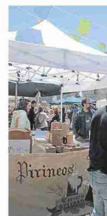
▲ Cata de vinos en el