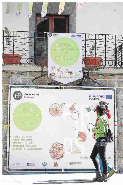
▲ Carteles del primer mercado, celebrado en Hecho.