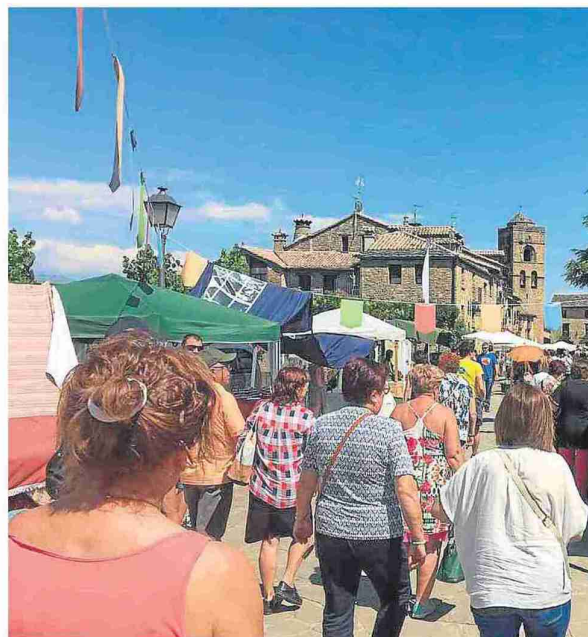
▲ Mercado celebrado en Aínsa en la pasada edición.

El domingo, a las 11.30 saldrá una excursión temática para niños desde la plaza de España al Castillo de Boltaña. Los que suban hasta la fortaleza tendrán paella popular, a las 14.00, en el parque Villaboya.