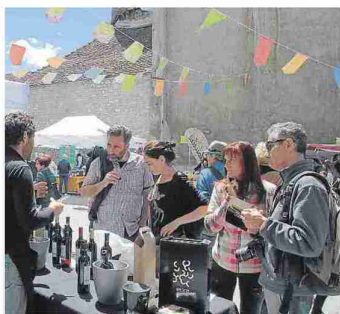
mercado celebrado en mayo en Hecho.

'La Almunia ¡Se rueda!' es el nombre de las jornadas que celebra este fin de semana la capital de Valdejalón. Mañana se realizará una recreación del rodaje de 'Nobleza Baturra', la famosa película rodada en varias localidades aragonesas por el director Florián Rey, nacido en La Almunia. Se espera la 'llegada' del propio cineasta a las 10.45 por la carretera de Madrid. La España de 1930 paseará por con personas vestidas de época y recreación de tiendas, entre multitud de actos. El domingo, a las 12.00, habrá una visita turística guiada por la Ruta del Cine y La Almunia.