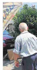
▲ Un puesto con deg

También se ha planificado en esta ocasión una visita organizada para los establecimientos de Boltaña y alrededores, en una iniciativa que quiere testear el interés en este tipo de productos por parte de profesionales y las posibilidades de su venta en cadena corta.