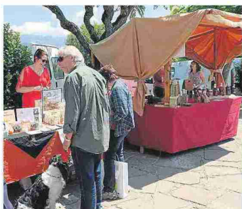
ustación de productos, en el mercado de Aínsa.