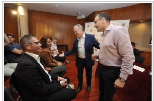
Presentación de Hecho en Pirineos en Huesca. DPH.

Cerca de medio centenar de personas han participado en este seminario de lanzamiento donde se ha conseguido reunir en un mismo espacio y en torno a una única iniciativa a productores agroalimentarios, de denominaciones de origen, del gremio de pasteleros, de slow food, cocineros con estrella Michelin y de escuelas de hostelería, agentes del sector turístico, representantes de los centros de desarrollo de la provincia, de la Universidad y de la investigación y otras personas vinculadas a estos sectores que tienen mucho que decir en este sentido.